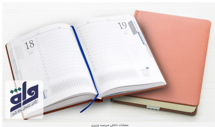
صفحات داخلی سررسید وزیری

لازم به ذکر است که امکان حک مستقیم لوگو روی همه جلد های سالنامه امکان پذیر نیست. از این رو در برخی موارد لوگو مورد نظر شما روی پلاک فلزی حک می شود. این پلاک ها توسط چسب های مخصوص به سررسید چسبانده می شود و جلوه زیبایی به آن ها می دهد.